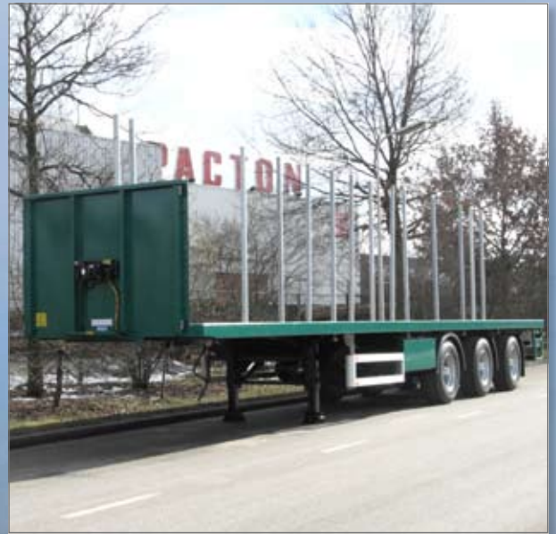
Rongkokers in de hartlijn