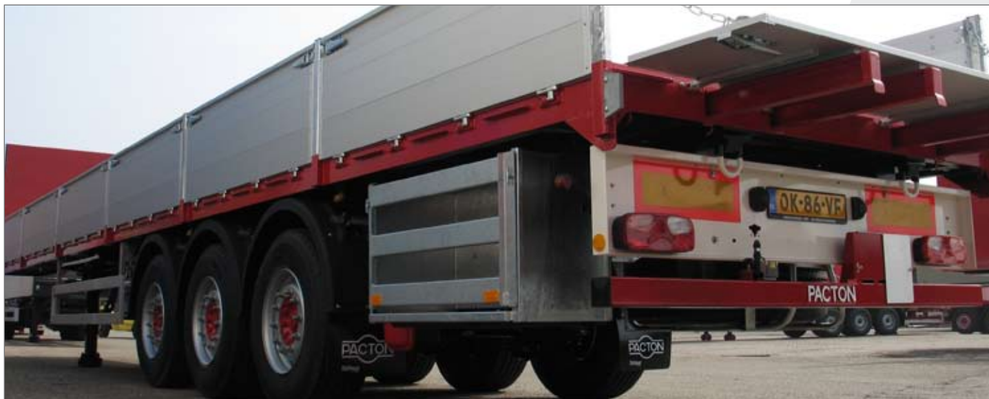
Vario X-press met uitschuifbalkjes en berijdbare achterklep

De vloer kan worden uitgevoerd met een coilgoot voor het transport van staalrollen. De assen kunnen zowel star als gestuurd worden uitgevoerd. Het kopschot en de heavy duty slijp-ogen zijn TÜV-gecertificeerd. De Vario X-press voldoet uiteraard aan alle wettelijk verplichte eisen.