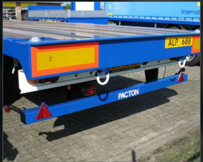
Twistlocks in de vloer, ferry-ogen en sjoerbanden