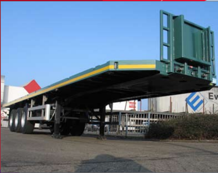
Custom made kopschot met afgeschuinde voorhoeken