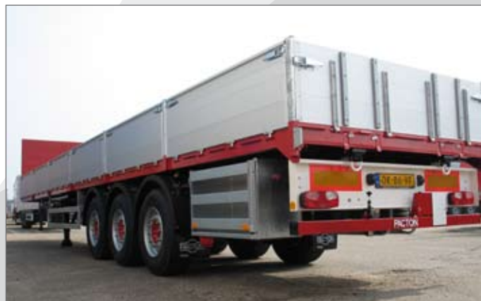
Uitvoering met 2x6 zijborden