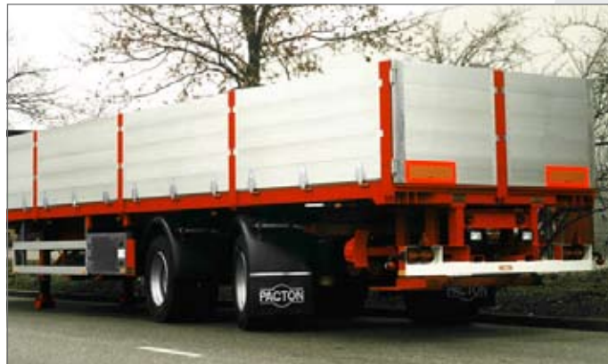
2-assige uitvoering met stuuras

De Vario X-press kan zowel met hoge als lage zijborden worden uitgevoerd. Voor het containervervoer kan de Vario X-press met in de vloer verzonken twistlock-aansluitingen worden geleverd.