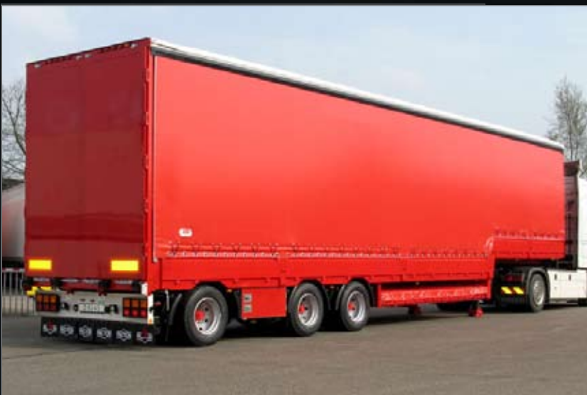
Strakke afwerking, zijborden en kist in kleur gespoten