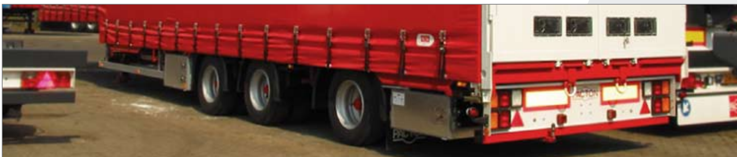
Deursluitingen verzonken in achterdeuren