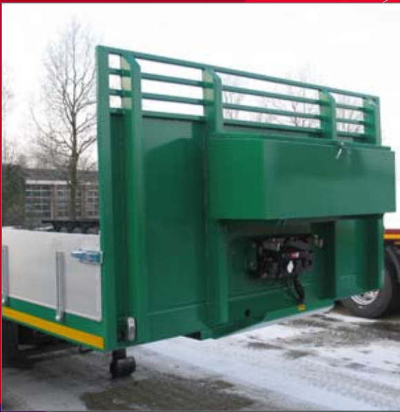
2-assige uitvoering met opbergkist aan kopschot