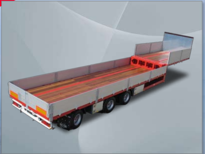
Achterste as gestuurd, diverse rondkokers in vloer