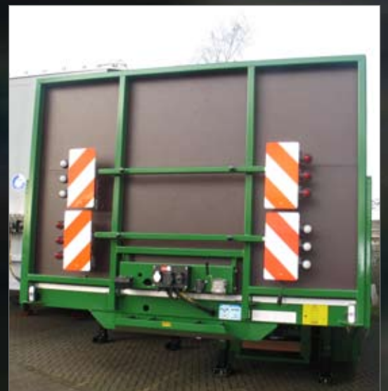
Kopschot met uitklapbare breedteborden