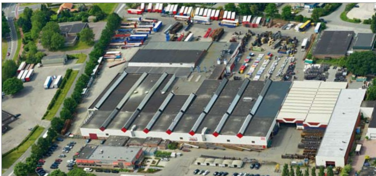
Pacton hoofdvestiging te Ommen